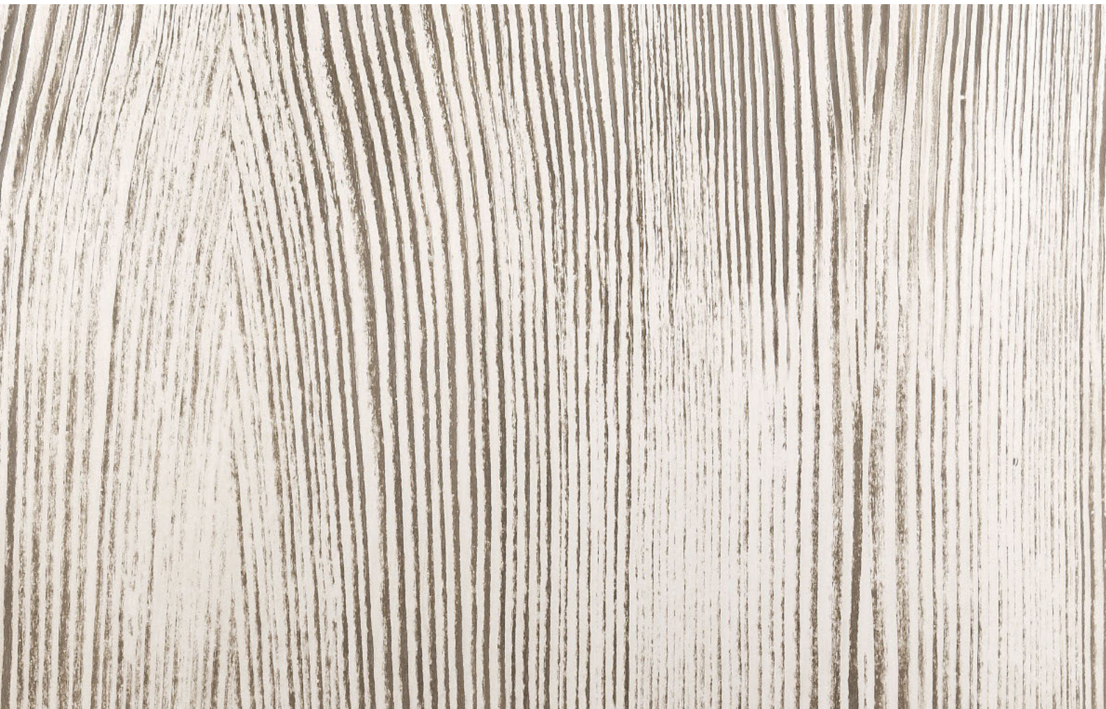
Ehrliche Holzstruktur trifft ländlichen Charme: Fertig ist der Modern-Country-Look