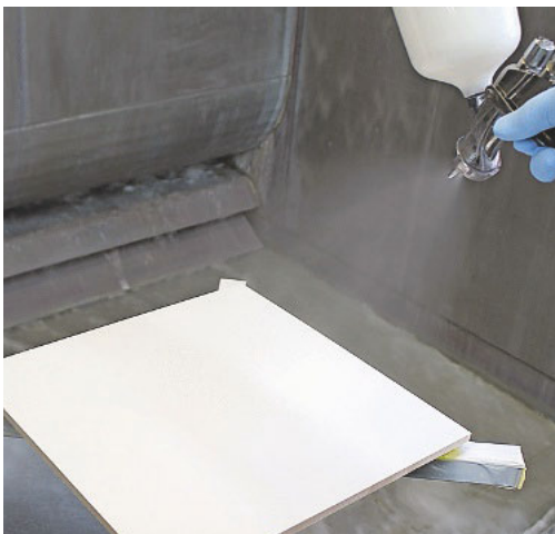
3. Anschließend wird der Farblack mit einem wässrigen Klarlack mit 100 g/m 2 überlackiert. Die Trocknung dauert ebenfalls vier Stunden bei 20 °C