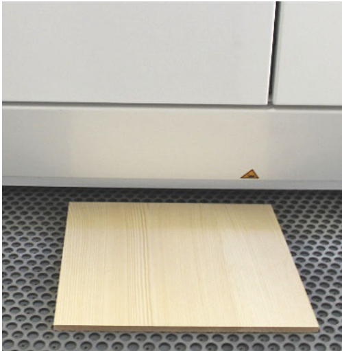
1. Schliff mit Korn 180 und Strukturieren der Oberfläche mit einem Bürstenaggregat, im Idealfall mit einem Schleifautomat