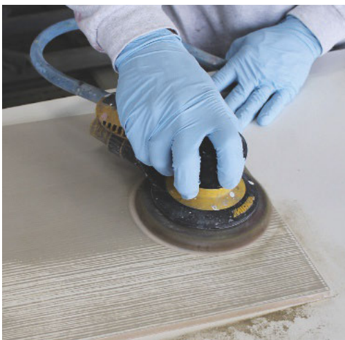
5. Mit dem Exzenterschleifer Korn 180 bis 320 wird die Wischbeize abgetragen. Sie verbleibt lediglich in den Poren des strukturierten Trägermaterials