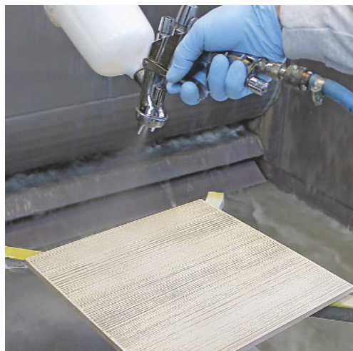
6. Die fertige Fläche wird mit einem farblosen Wasserlack mit 100 g/m 2 endversiegelt. Dann 16 Stunden bei 20 °C trocknen lassen