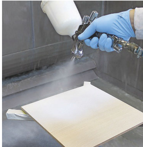
2. Auftrag eines wässrig basierten Farblacks mit 120 g/m 2 . Im Anschluss für vier Stunden bei 20 °C trocknen lassen